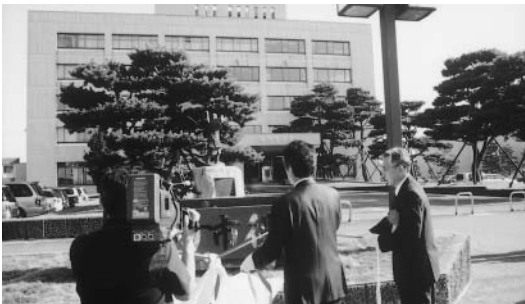
胎内市役所 開所式

条町役場職員の採用に関して、議員の身分を利用して関係幹部職員等に依頼したとされる事実関係を委員9人で構成する調査特別委員会を設置し調査しようとするもので、賛成多数で可決された。