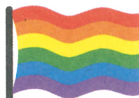
レインボーフラッグ LGBTの象徴として6色の 虹色が使われています。

LGBTは13人に1人の割合と言われています。「会ったことがない」という人も、気づかなかっただけなのかもしれません。LGBTについての知識を持ち、性の多様性を理解しましょう。