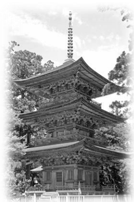
国指定重要文化財乙宝寺三重塔