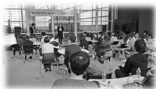
ライフデザインセミナー*の様子