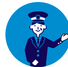
50代男性ドライバー (ドライバー歴1年7カ月)