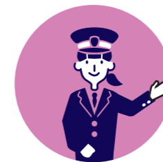
20代女性ドライバー (ドライバー歴2年)

以前はトラック運転手をしていましたが、転職してタクシー運転手になりました。車の運転が好きの方は向いている仕事だと思います。頑張れば頑張った分だけ結果が出ること。そして、シフト勤務なので休みがある程度自由にとれるところが仕事の魅力です。