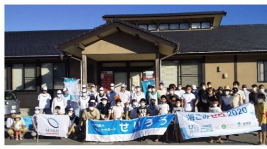
他団体とも一緒に活動します