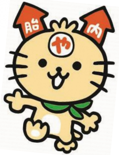
胎内市 やらにゃん