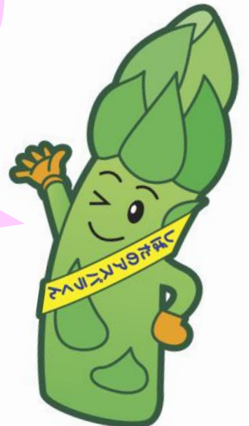
新発田市 アスパラくん