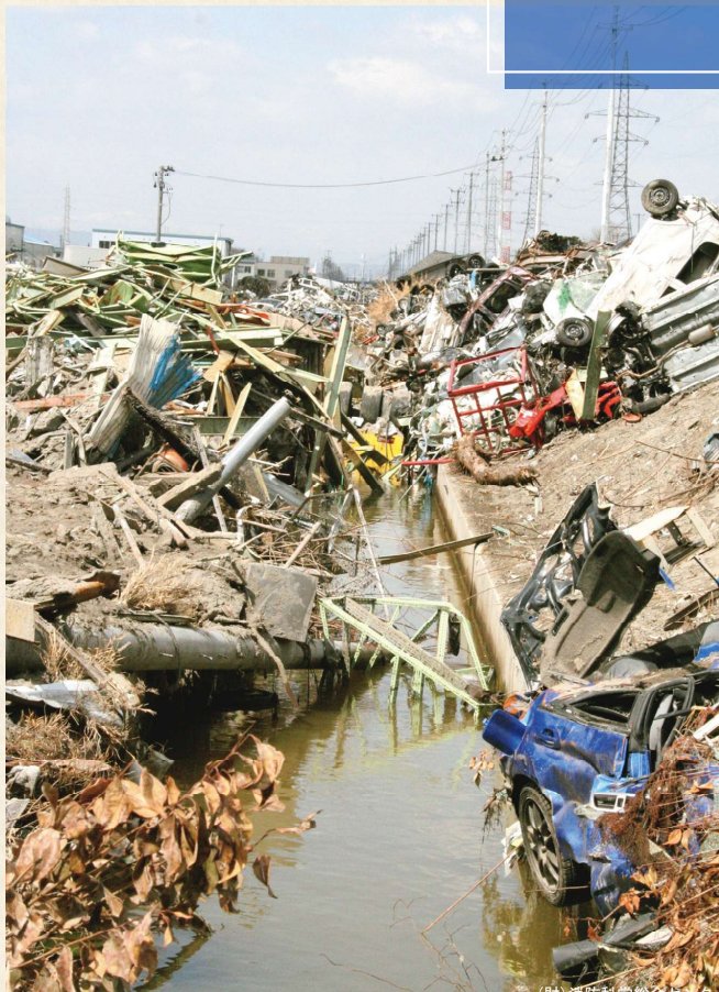
東日本大震災