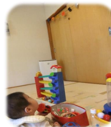
ハロウィンの飾りが気になる…

子育て支援センター こあらクラブ 中条すこやかこども園 10月は、ハロウィンがあるということで、お部屋の中もハロウィン仕様に変身！