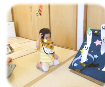
あれ、自分につけちゃった～