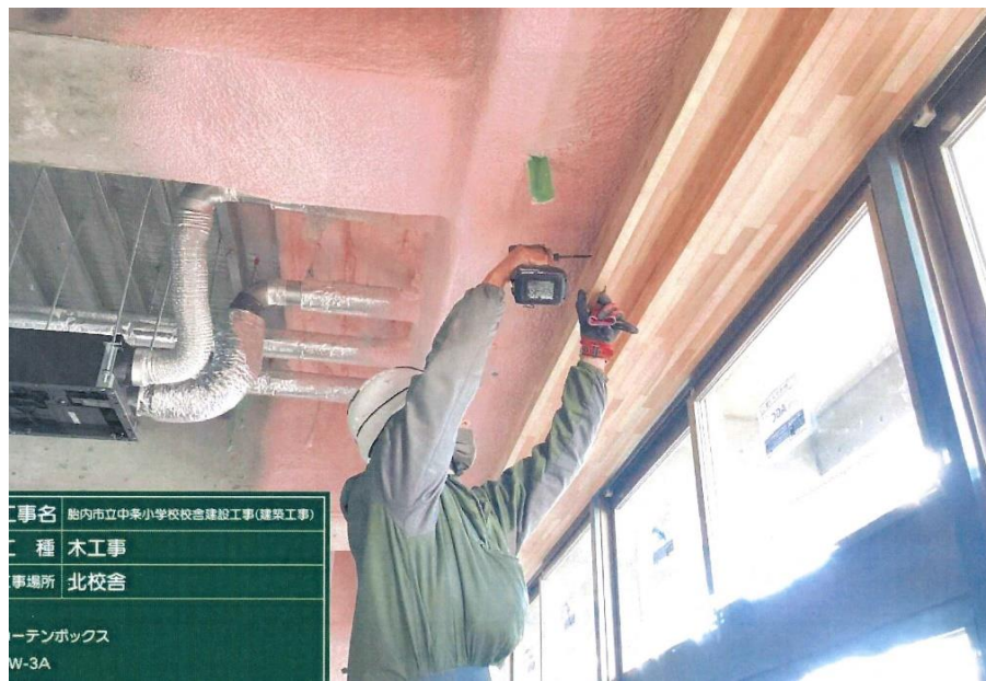
▲北校舎棟内部カーテンボックス取付