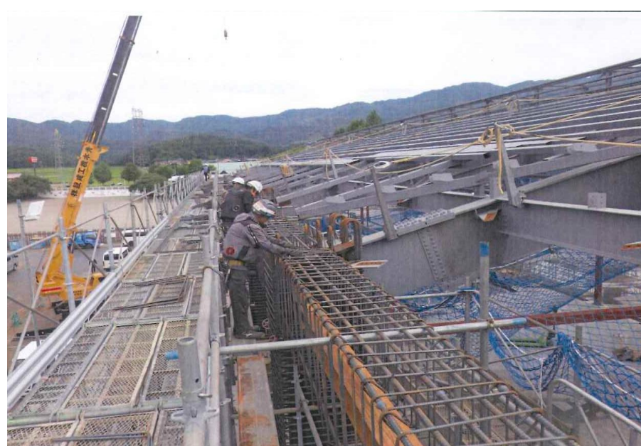
▲南校舎2階躯体梁配筋