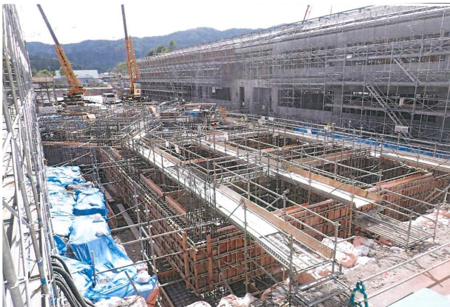
▲昇降口図書館・基礎鉄筋・型枠組立状況