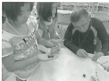
ボランティアさんに「どんぐりコマ」を作ってもらったよ!(胎内小)