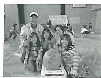
ハロウィンランタン、今年も上手にできました(黒川小)