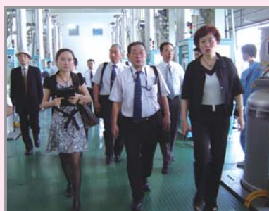
綏化市シリコンウェハー工場視察

力を求めました。今後、胎内市・綏化市では行政（政府）関係者、議会議員（人民代表委員会）、各種団体役員などの人的交流を図りながら、教育・文化、スポーツ、産業、観光など幅広い分野での相互交流を検討していくことになっています。