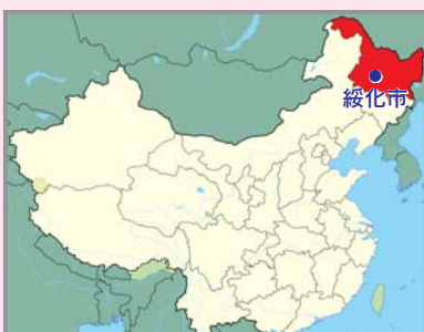
黒龍江省・綏化市の位置図