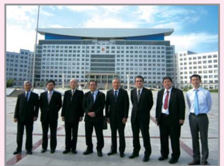
綏化市政府庁舎前での記念撮影