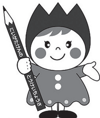
新潟県の統計イメージキャラクター

統計調査の実施数や規模は年によって異なりますので、年間を通じて調査に従事できるとは限りません。登録してもすぐには調査事務にあたらなない場合があります。