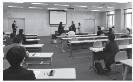
胎内市地域学校協働本部 担当者会議

会議では、「支援」から「連 携・協働」へと取組を強化 し、社会全体で子どもを育 んでいくことの重要性につ いても説明がありました。 今年度、全ての小中学校 で、地域の方々と目標を共 有するコミュニケーション・ス