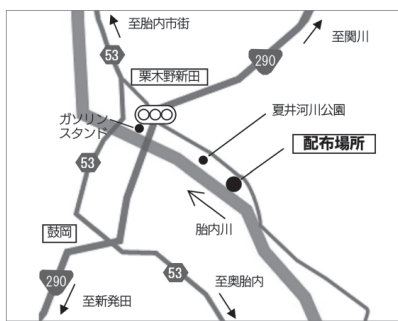
図2：②夏井地内(胎内川右岸)