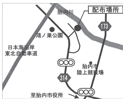
図1：①清水地内(胎内川左岸)

詳しくは、新発田地域振興局のホームページをご覧ください。 岡県新発田地域振興局地域整備部 ☎22・5113