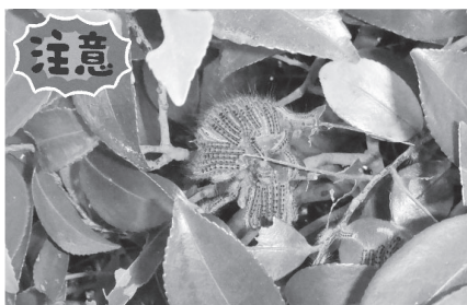
チャドクガの幼虫