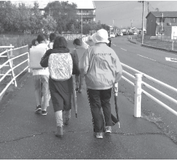
毎日の登校班見守り (見守り隊)