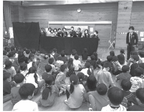
大好評の指人形劇 (図書サポーター)