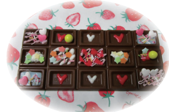
【板チョコデコ教室】