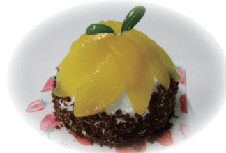
【ズコットデコ教室】