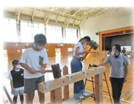
▲おしごとたんけん 体験活動の様子

子どもや学校の思いから、地域の方から竹を準備していただき、子どもや保護者の書いた短冊を飾りました。今後も、地域とともに、よりよいきののと小学校をつくっていくように、取り組んでいきます。