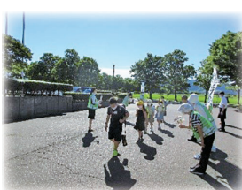
▲毎月のあいさつ 声かけ運動の様子