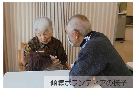
傾聴ボランティアの様子

人間はつながり支え合って生きる生き物です。孤独な生活やストレスの多い世の中を生き抜くにはきついのではないかと思います。共に支え合い、助け合って生きるために、一緒に活動してみませんか。ボランティア活動は人のためよりも自分の向上のために行うものです。共感していただける方のご参加をお待ちしています。